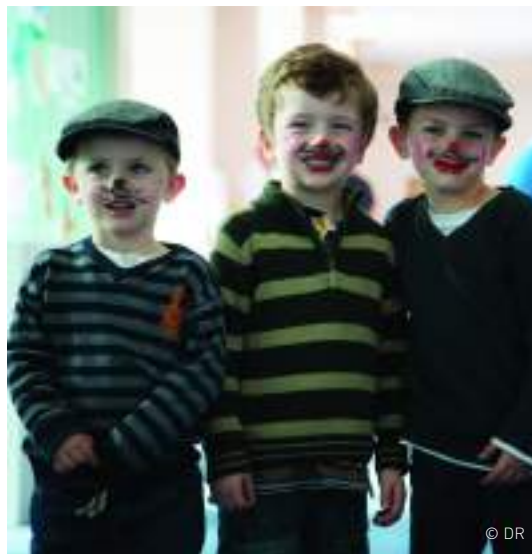
Family Fun Day au Lighthouse

formation continue en direction des professionnels et des personnels administratifs des lieux partenaires